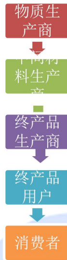
图 2 食品接触材料供应链

料或成型品（以下统称终产品）。因此，我们将塑料食品接触材料供应链梳理如图 2 所示。